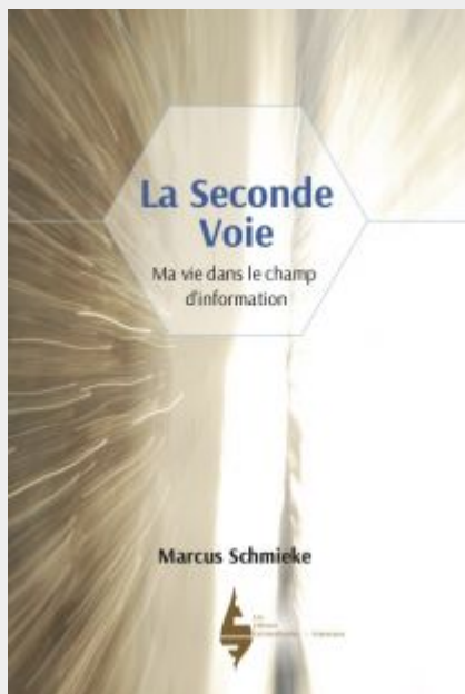
La seconde voie, par Marcus

résultats étonnants qu'elle en retire, qui ont changé la médecine et offert de nouvelles possibilités pour des patients en souffrance depuis des dizaines d'années. L'effet résonance est autant l'histoire de son parcours personnel exemplaire qui lui a fait trouver le courage de trouver sa vocation, et un rapport sur le développement remarquable d'un traitement redécouvert, les micro-courants spécifiques en fréquence (FSM) qui tirent parti de la capacité de notre corps à répondre aux fréquences pour soigner de nombreuses pathologies chroniques. Névralgies, fibromyalgie, neuropathies diabétiques, douleurs musculaires, performance sportive, blessures, douleurs articulaires, lombaires, au cou, liées à des calculs rénaux, les calculs eux-mêmes, maladies du foie, plaies diabétiques, douleurs au cerveau ou à la moelle épinière, stress post-traumatique, dépression, zona, asthme, kystes ovariens, adhésions abdominales, cicatrices... toutes ces pathologies répondent à des fréquences spécifiques. McMakin explique que les résultats sont prévisibles, reproductibles, et qu'on peut les apprendre %u2014 tout ceci sans effets secondaires %u2014 ce qui donnera un espoir de guérison à des millions de malades. Des études de cas illustreront l'efficacité du traitement et expliqueront les fréquences spécifiques que chaque pathologie requiert pour soigner les patients.